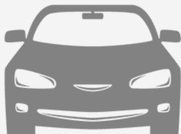
IMMAGINE NON DISPONIBILE